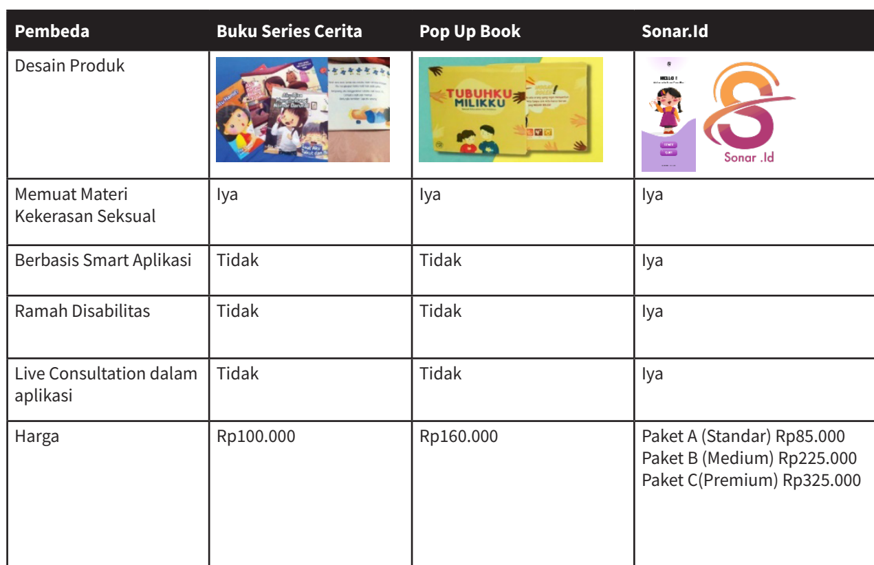
Tabel 2. Analisis Kompetitor dengan Produk Sejenis